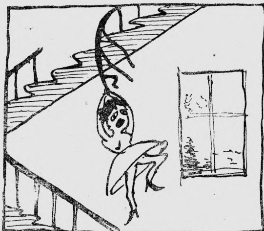
О чем эти карикатуры? Студентам-электрикам, живущим в общежитии № 2, не нужно гадать над их смыслом.